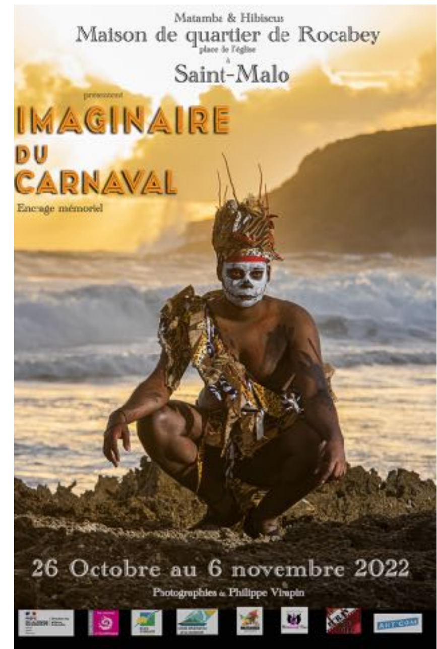
Affiche de Saint-Malo