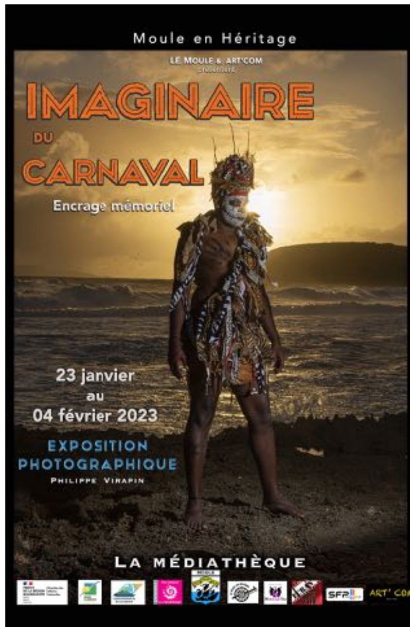
Affiche du Moule